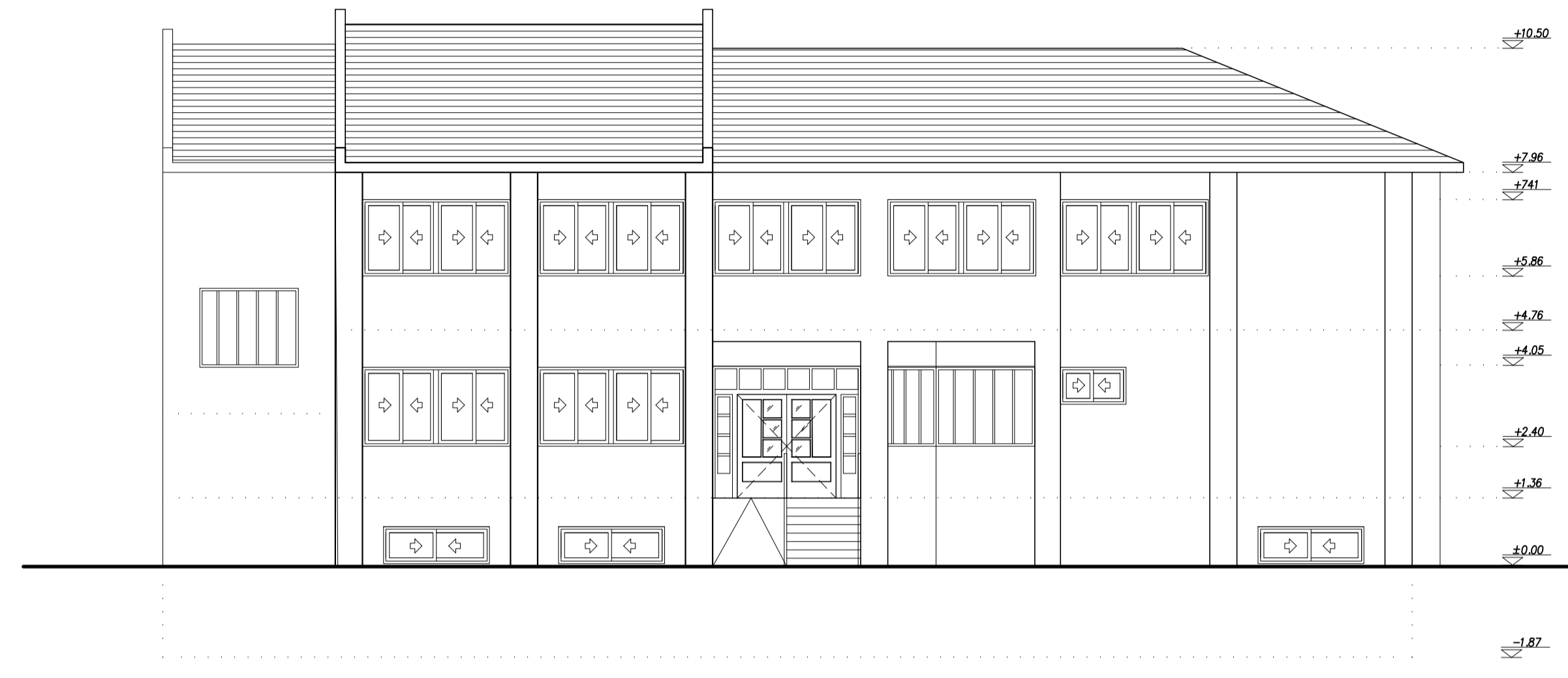
ΝΟΤΙΟΔΥΤΙΚΗ ΟΨΗ - ΠΡΟΣΟΨΗ